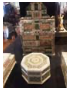
Резьба из Кости